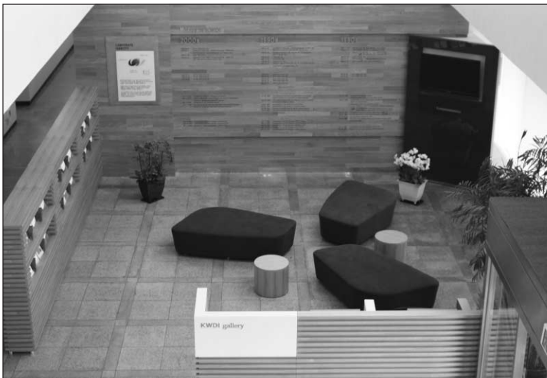
▲ 위에서 본 내부 전경