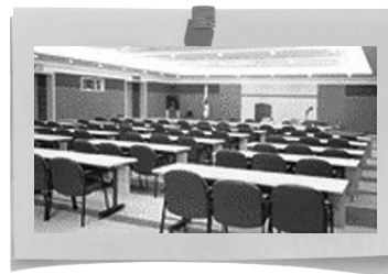
< 국제회의장 >

1층 홀과 2층 객석의 형태로 구성되어 대규모행사 집회 가능 최대 1,300명까지 이용가능