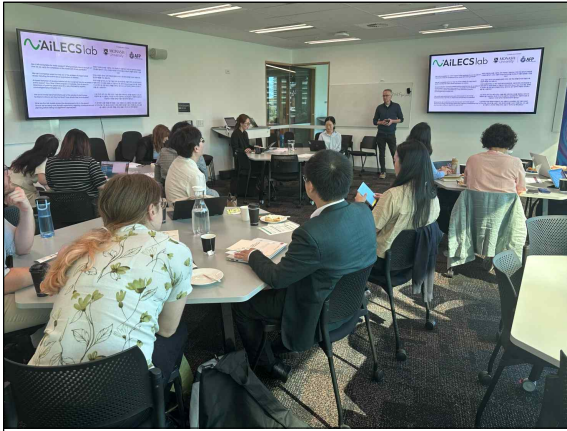
<5일차> 공동 설계 워크숍