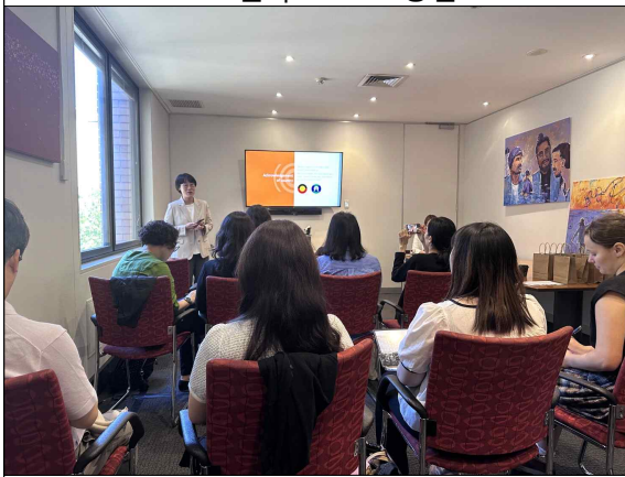
<5일차> 공동 설계 워크숍