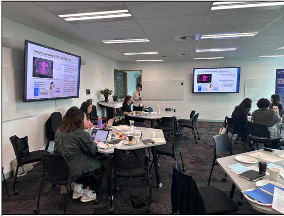
<3일차> 지식 공유 워크숍