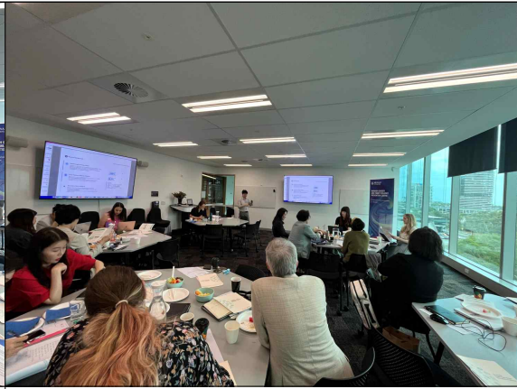
<3일차> 지식 공유 워크숍