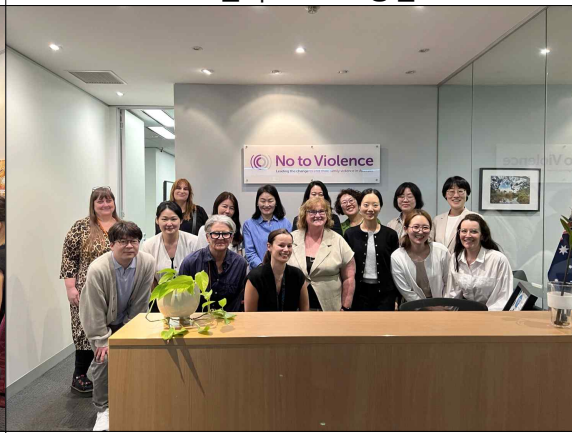
<5일차> 공동 설계 워크숍