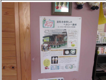
홍보전단지 부착된 두부 레스토랑 실내